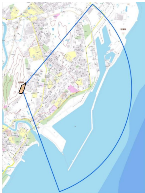
花蓮縣花蓮市美崙山重要軍事設施管制區範圍圖